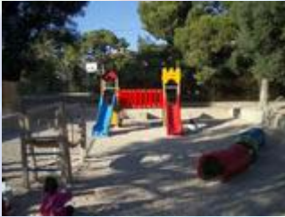
Un parque infantil para su uso exclusivo.