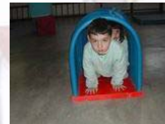
Aula de psicomotricidad